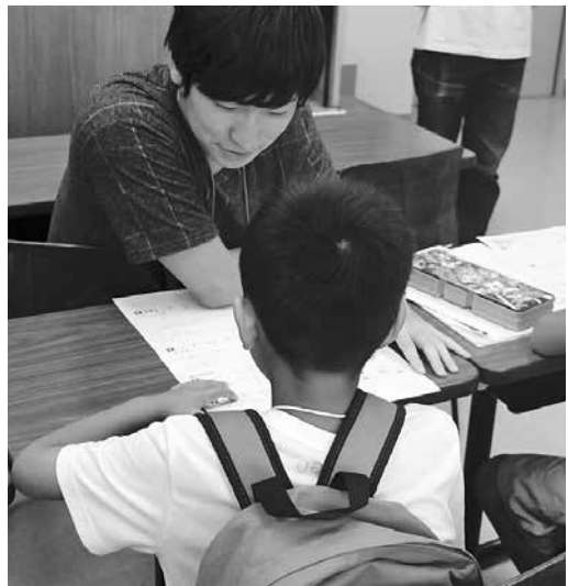
大学生と宿題をする子どもたち