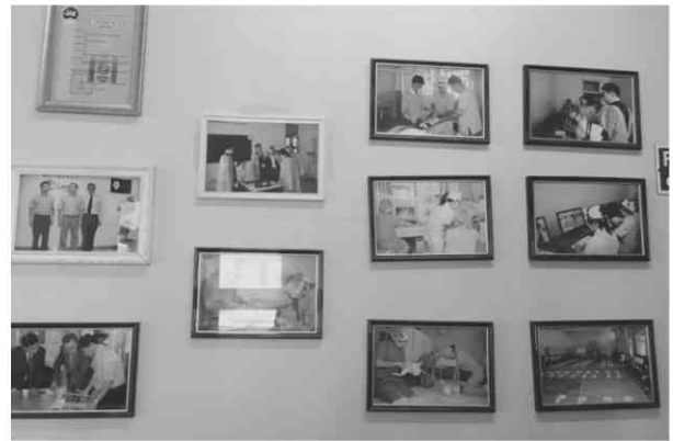
国立モンゴル医科大学の歴史