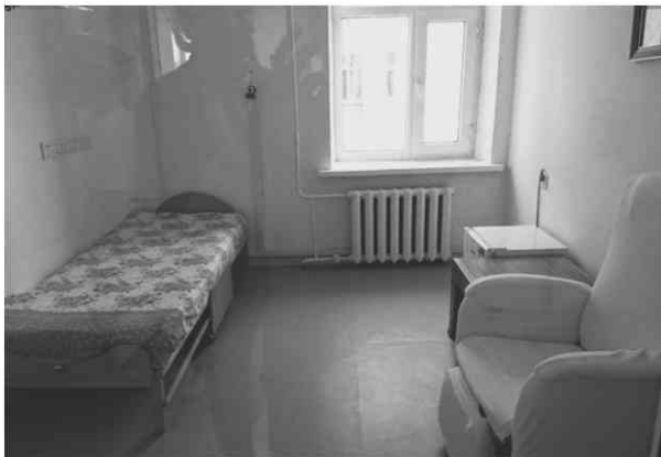
Maternity and Child Health Hospital 病室