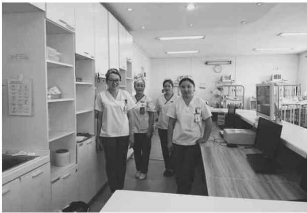
Maternity and Child Health Hospital 集中治療室

講義はモンゴル語の通訳を介して行ったが、学生の中には日本語が理解できる学生いた。日本に留学することに関心を寄せる学生が多数おり、具体的な留学に関する質問も活発に出た。