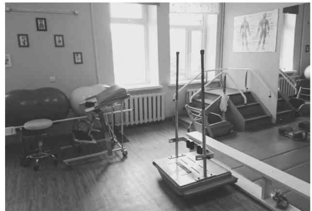
Maternity and Child Health Hospital リハビリテーションルーム