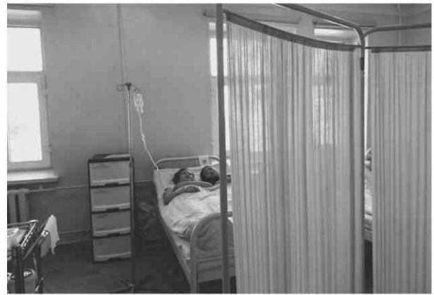
Maternity and Child Health Hospital 処置室