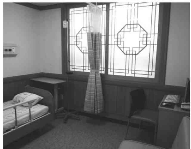
写真6 ハルリム大学病院の個室内部