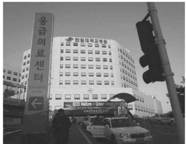
写真5 ハルリム大学病院