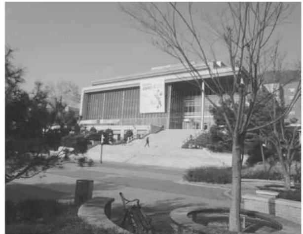
写真4 ハルリム大学図書館