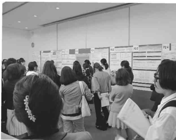
写真3 ポスター会場