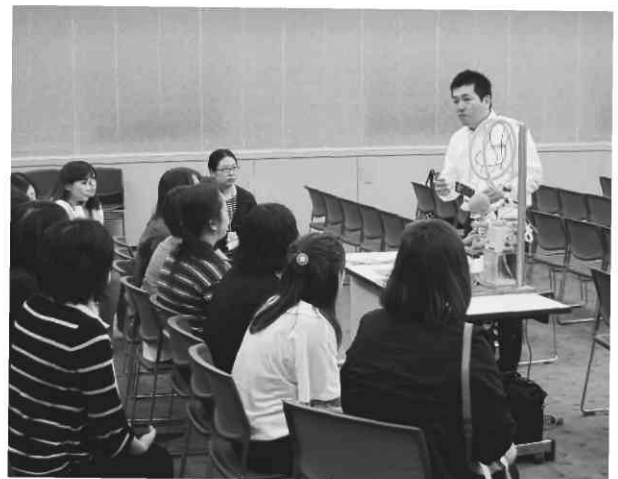
写真4 実演によるセッション