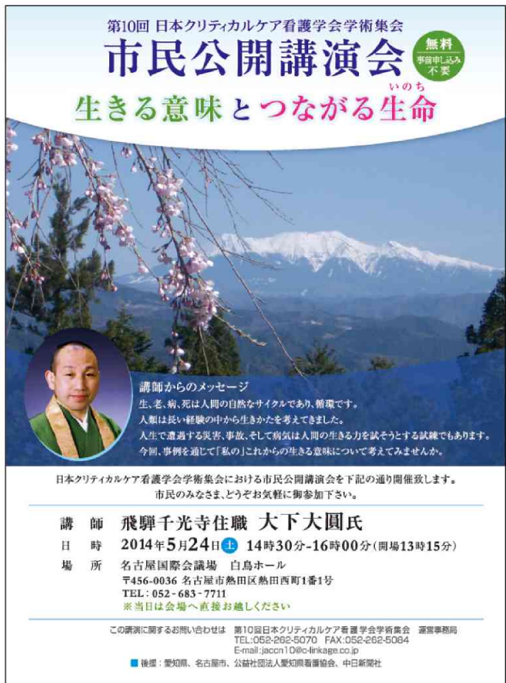
図4 市民公開講演会のポスター・チラシのデザイン

円滑に企画を進めるために、常に互いの作業の進捗状況を知り情報共有ができるような工夫も行いました。まず、メーリングリストを作成して全委員が相互に情報を発信し、意見交換できるようにしました。また、情報はクラウドを活用して作成したファイルをアップするようにし、誰もが常に最新の情報を確認できるようにしました。