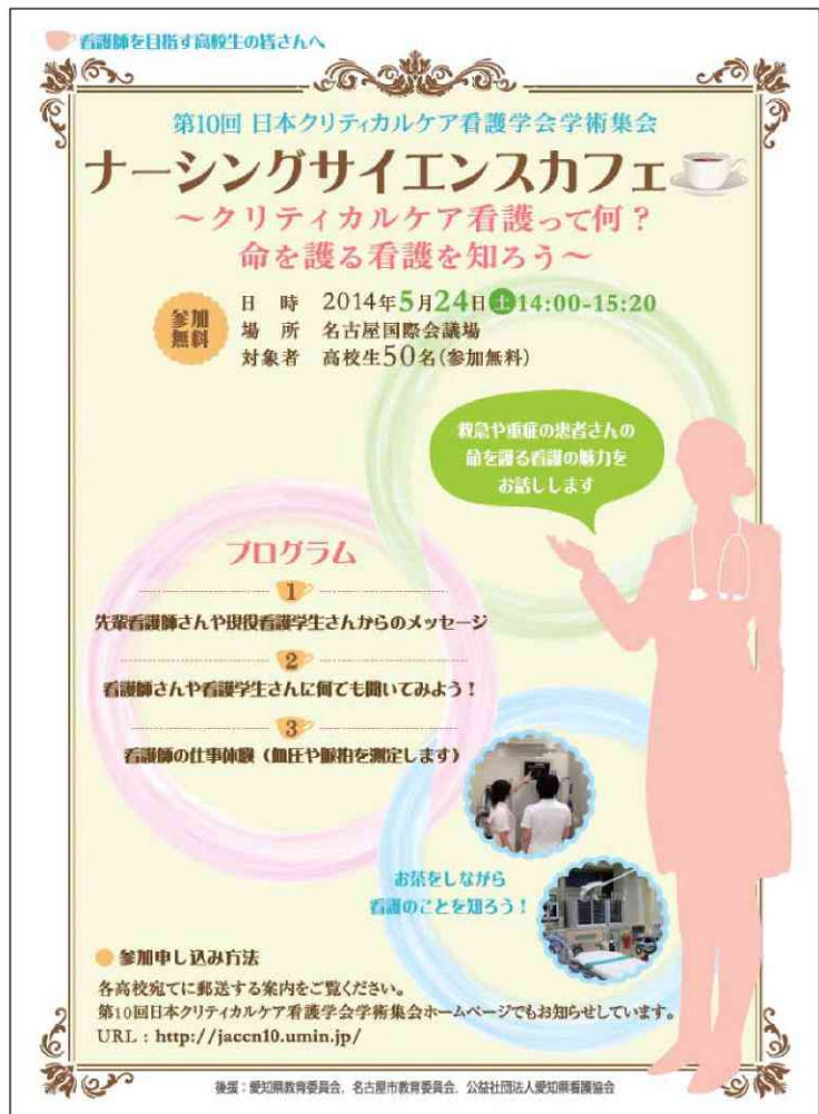
図3 ナーシング・サイエンスカフェのチラシのデザイン